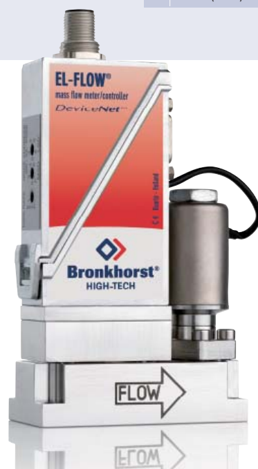
Регулятор расхода EL-FLOW под поверхностный монтаж, модель TA-201CM с металлическими уплотнениями