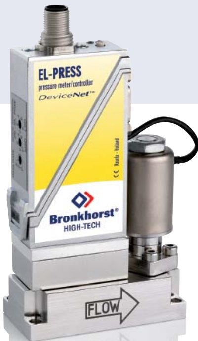
Регулятор давления EL-PRESS под поверхностный монтаж, модель TA-702CM с металлическими уплотнениями