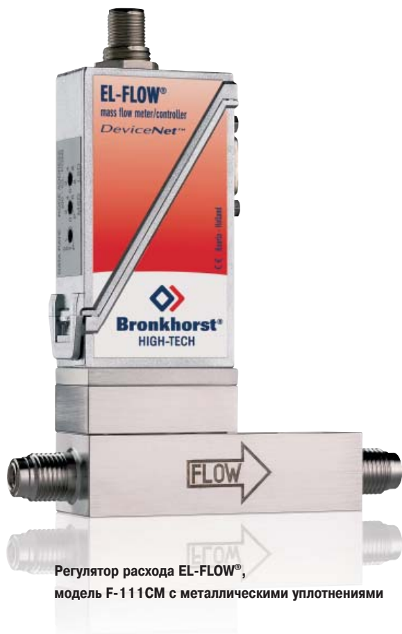
Регулятор расхода EL-FLOW®, модель F-111CM с металлическими уплотнениями