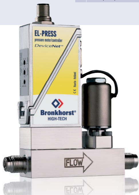
Регулятор давления EL-PRESS, модель P702CM с металлическими уплотнениями